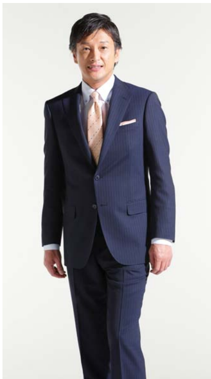
熱遮蔽機能サーモグラフィー比較 東洋紡株式会社調べ

「熱遮蔽」機能スーツには、繊維メーカー4社の4素材(下記参照)を使用し、「REGAL」、「CHRISTIAN ORANI」、「KANSAI YAMAMOTO」、「PERSON'S FOR MEN」の4ブランドで展開します。