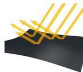
「熱遮蔽」イメージ画像