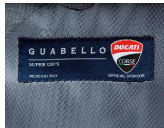
「HILTON」では、SUPER130'S、最高級カシミアをはじめ、世界のトップブランドの生地を採用