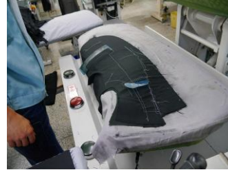
「HILTON」は、流麗さを保つための立体縫製で、シルエットの美しさを引き立てる。