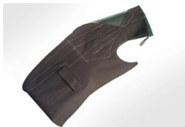
体にフィットした立体的なシルエットのラベル毛芯を使用する。