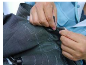
ハンドメイドスーツでは、体に一番密着する首部分のあたりを柔らかくするため、襟部分は手縫いを施す。