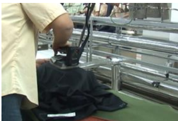
中間プレス工程は 30 回以上行い立体的なシルエットに仕上げる。

また、スーツ・礼服全商品にはラベル毛芯仕立てを採用しています。立体的なスーツを作成するには、毛芯が非常に重要な役割を果たします。ハンドメイドスーツでは、襟付け、袖付け、肩付けなど着心地を左右する重要な箇所については熟練職人が手縫いを施し、身体に馴染む着心地を実現しています。