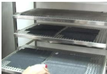
生地試験によって強度などを確認