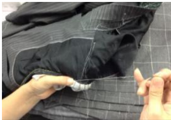
ハンドメイドスーツは、脇に密着する袖裏とじを丁寧に手縫いで行い、抜群の着心地を実現する。