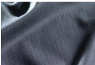
物性テスト、検反など独自の基準で厳選された表生地

スーツの出来栄を最も左右するのが表素材です。当社は生地専門セクションを設立し、原毛・糸の撚り・糸の密度・織組織などを生地メーカーと打合せを行い商品開発を行っています。スーツの裏地には、旭化成のキュプラや東レ・テイジンの大手合繊メーカーの裏地を採用し、袖裏には、大部分の商品にスベリ・なじみの良いキュプラ 100%素材を使用しているのも当社ならではの“こだわり”の一つです。