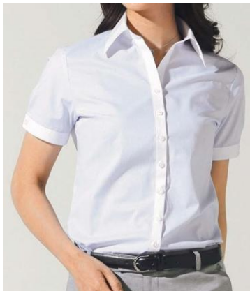
スキッパークレリック (クール)