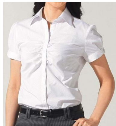
スキッパーギャザー (キュート)

・機能:生地には銀粒子を付与することで、抗菌防臭・制菌効果を実現。形態安定機能。ストレッチ機能。